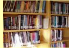
کتابخانه های خوابگاه غنی تر شدند