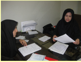
جلسات مشاوره ، توسعه نشاط