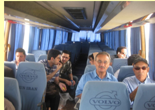
پزشکان فردا خوابگاههای امروز